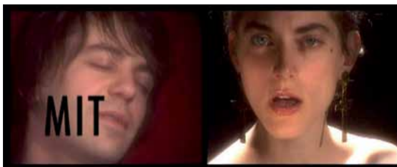
sopra: fotogramma dal film "Rebus per Ada" di Fanny e Alexander